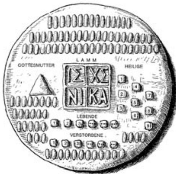
Abb. 2: Abendmahlsteller

symbolisiert, und auf den Diskus (= Teller) gelegt. Darum werden Brotstücke für die Gottesmutter, für die Propheten und Heiligen, für den Namenspatron der Kirche sowie für Lebende und Tote drapiert (vgl. Abb.2) „So ist der Diskus symbolisch die Kirche aller Zeiten um das Lamm = Christus versammelt.“ 3